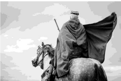
Fotografia 1/7 2013 Argentique

Nadjib Rahmani – Fotografo – Alger (Algeria)