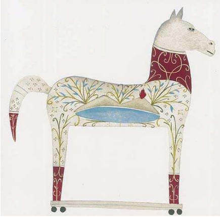
Disegni per il film di A. De Lillo LXX e Edizione del Festival del Cinema di Venezia

Oreste Zevola – Illustratore – Napoli (Italia)