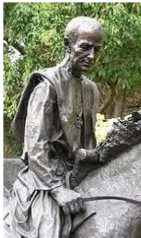
Sigerico a cavallo

Sarà proposto a questi viaggiatori, venuti da tutti i paesi alla ricerca di un rapporto col mondo più armonioso, un cammino che permetta a tutti di acquisire dei principi fondamentali sul piano artistico e sul rapporto con i cavalli .