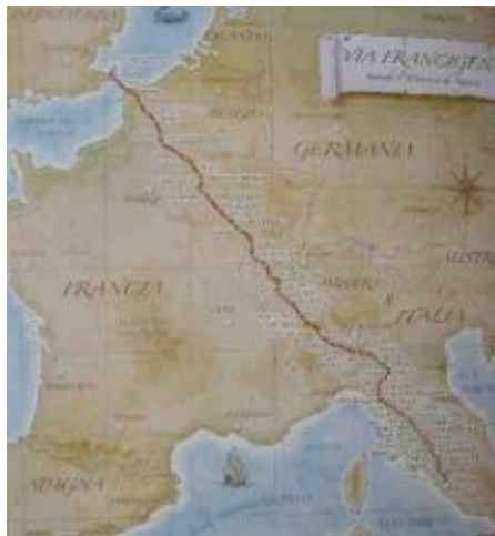
Il percorso della Via Francigena

Non dobbiamo dimenticare che storicamente, il pellegrinaggio della Via Francigena non era esclusivamente religioso, né esclusivamente pedonale. Infatti, fu un'importante arteria di crescita economica in particolare con la ripresa del commercio internazionale al XI° secolo ; facendo del cavallo uno dei mezzi principali per percorrere questa strada di 1700km.