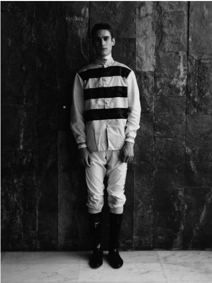
Ritrato Digigraphie sur papier archival Hahnemühle 1/8 2012 signé

Diana Lui – Fotografa – Parigi (Francia)